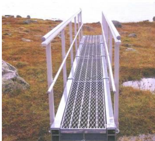
Brua som er tenkt oppført vil sjå slik ut.

Mysubyttedalen fortset i forlenginga av Ostradalen, innover frå Mysubytta seterstul som ligg i skoggrensa 850 moh. Dalen fører inn til vasskiljet mot Jostedølavassdraget, heilt i austkanten av Jostedalsbreen. Området er prega av snaufjell med ein vill vassdragsnatur. Dei mange og store breområda som omkransar dalen drenerer ned i dalen og vassføringa kan til tider gjera framkomsten heilt utilgjengeleg. Det er få inngrep i dalen. Det er oppført 2 fiskebuer ved utløpsosen på Mysubyttvatnet. I tillegg er det bygd bru over Storgrove. Ein mindre bru over Viergrove har reist i flom. Ved innløpsosen i vestenden av Mysubyttvatnet ligg DNT hytta Slæom.